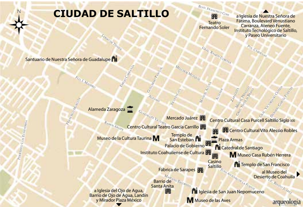
Museo del Desierto, Saltillo.