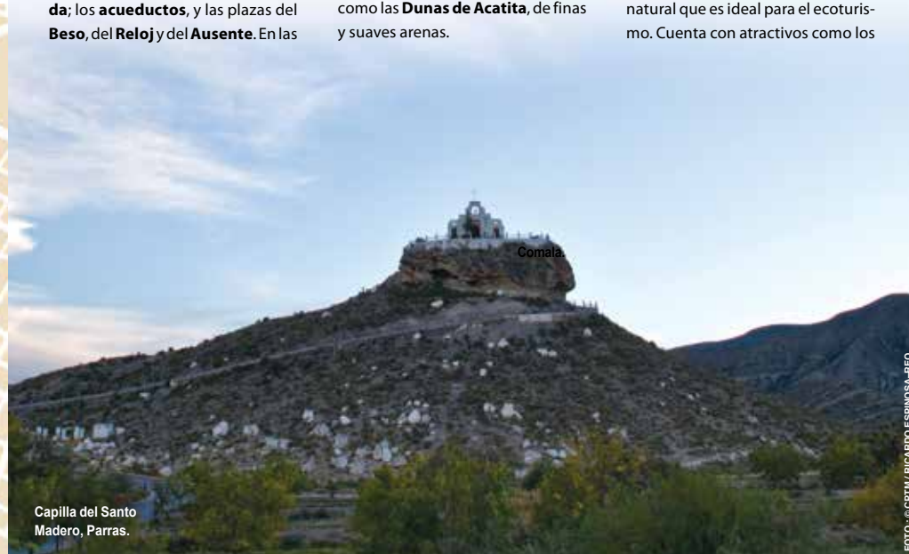
Capilla del Santo Madero, Parras.

Esta ciudad, fundada a fines del siglo XVI, se encuentra en un rico entorno natural que es ideal para el ecoturismo. Cuenta con atractivos como los