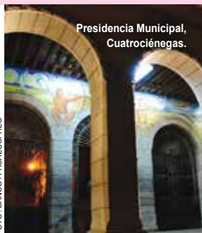
Presidencia Municipal, Cuatrociénegas.