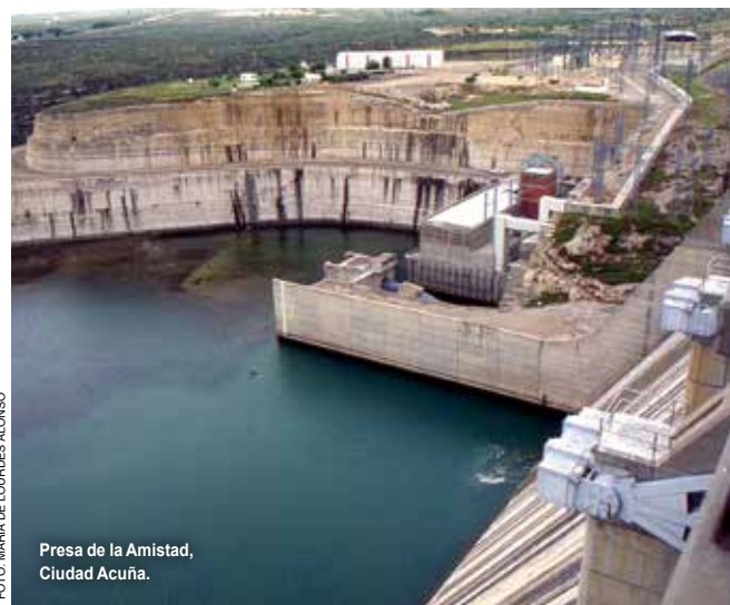
Presa de la Amistad, Ciudad Acuña.