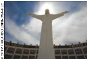
Cristo de las Noas, Torreón.