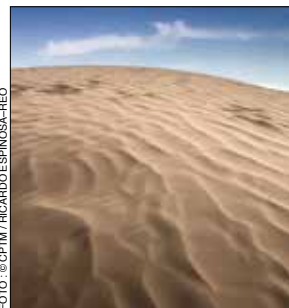
Dunas de Bilbao, Viesca.

Aquí se encuentra la Capilla de la Hacienda Santa Ana de los Hornos , edificada en el siglo XVIII, una de las construcciones más antiguas de la Comarca Lagunera. En las cercanías están las Dunas de Bilbao .