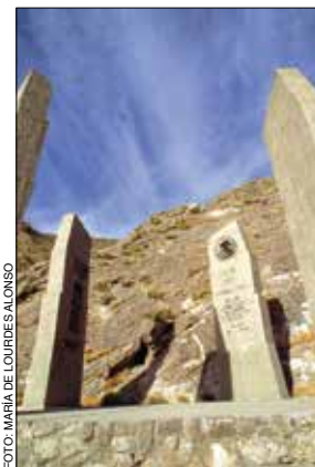
Cueva del Tabaco, Matamoros.