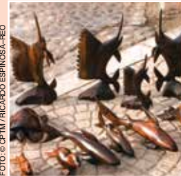
Esculturas de palofierro.

Sonora posee una interesante tradición artesanal en la que destacan las realizadas por sus grupos indígenas. Entre ellas se encuentran las esculturas de madera del árbol palofierro , elaboradas por los pueblos del desierto. Otros productos son los muebles de Aconchi; las artesanías de grava de río y ramas de Huépac; la talabartería de Ures y los guarís (cestos) de estilo mayo de Navojoa.