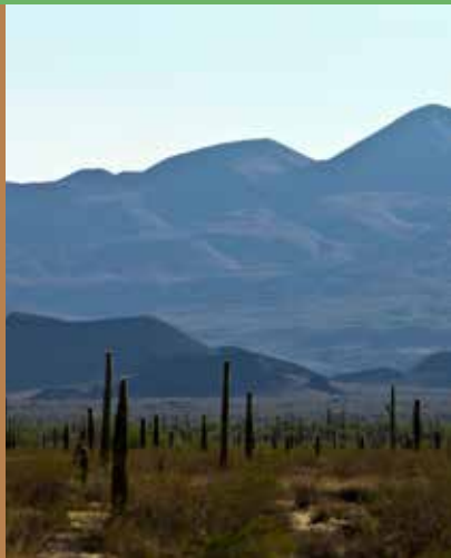
PORTADA: ÁLAMOS. FOTO: ARNULFO VALDIVIA / CONACULTA. CONTRAPORTADA: RESERVA DE LA BIOSFERA EL PINACATE. FOTO: © CPTM / RICARDO ESPINOSA-REO

CANIRAC Hermosillo: Sahuaripa esq. Paseo de los Jardines Local 3-B, Col. Valle Grande, C.P. 83250, 662-302-2201, canirac_hermosillo@hotmail.com , canirac_sonora@hotmail.com