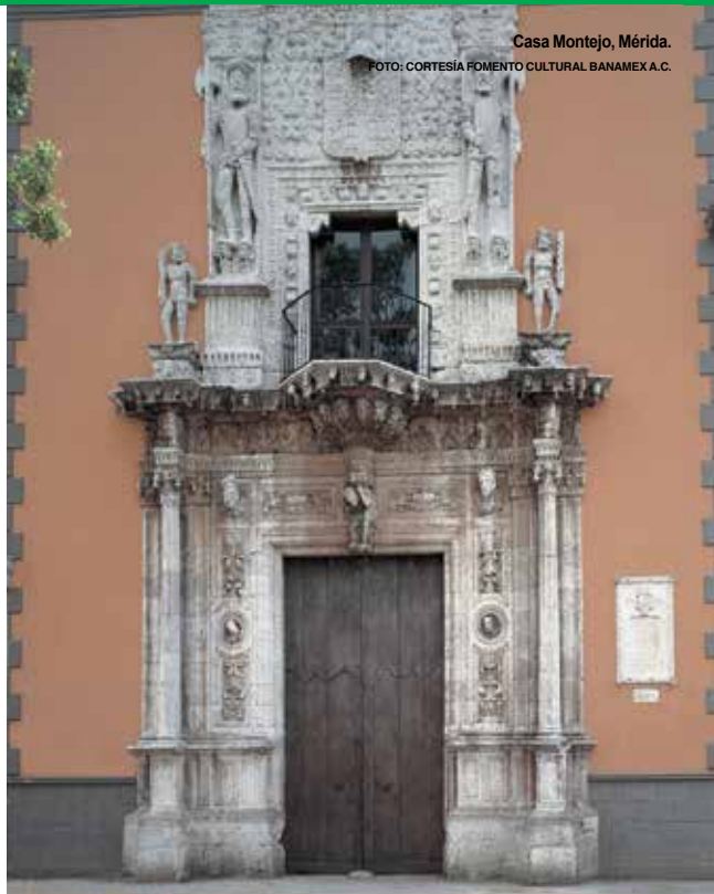
Casa Montejo, Mérida.

Además de capital de Yucatán, es el centro económico y cultural del sureste de México. Fundada por Francisco de Montejo, el Mozo, en 1542, posee el trazado rectangular, con calles anchas, de norte a sur y de oriente a poniente, característico de las ciudades coloniales. Por la blanca vestimenta típica de sus pobladores, por la limpieza proverbial de sus calles y el revestimiento de cal de las primeras construcciones, Mérida es conocida como la "ciudad blanca". La ciudad posee un importante centro histórico que alberga una buena cantidad de construcciones coloniales y del siglo XIX, entre las que destacan la Catedral , una de las más antiguas de México, el Palacio de Gobierno y la Casa Montejo , una espléndida casa que perteneció al linaje fundador de la ciudad. Mérida cuenta además con museos que dan cuenta del desarrollo de la cultura maya y de la historia de la ciudad.