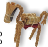
Caballo de ixtle. Estado de México

Asimismo, el jurado designará las menciones honoríficas que considere necesarias, sin dotación económica.