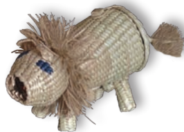
Cerdo de palma. Guerrero

Para aclarar dudas o hacer cualquier consulta, están a disposición los teléfonos 01 (55) 4155 0356/ 55/ 65 y los correos electrónicos evazquez@conaculta.gob.mx / adiazg@conaculta.gob.mx