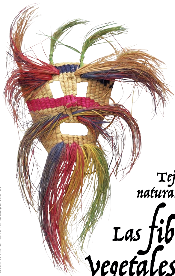
Máscara de palma. Nahuatl. Tlaxcala. Guerrero

En esta totalidad, fibras vegetales, técnicas y objetos, se encierran los saberes y conocimientos que forman el Arte Popular, por ello la importancia de registrarlo y difundirlo como patrimonio cultural de México, especialmente para las futuras generaciones.