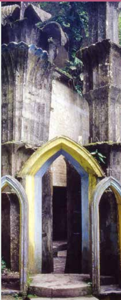
PORTADA: REAL DE CATORCE. FOTO: DAVID SILVU. CONACULTA. CONTRAPORTADA: LAS POZAS, XILITLA. FOTO: SERGIO AUTREY/RAÍCES

CONACULTA Presidenta Lic. Consuelo Sáizar