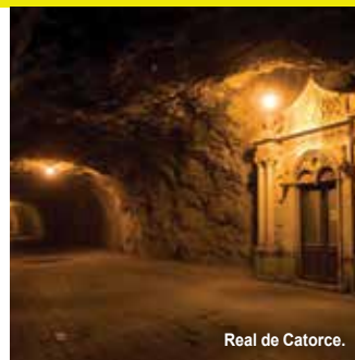
Real de Catorce.

San Luis Potosí es un estado con una extraordinaria y rica diversidad natural, por ello cuenta con varias áreas protegidas en las que además de acercarse a la naturaleza pueden realizarse distintas actividades. Entre esas áreas naturales se encuentran la Reserva Natural de Wirikuta , la Reserva de la Biosfera del Abra-Tanchipa , la Reserva Estatal Real de Guadalcázar y el Parque Nacional El Gogorrón .